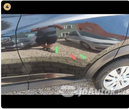
! bal hátsó ajtó 3 db horpadás