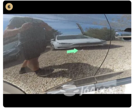
! jobb hátsó ajtó enyhe horzsolás