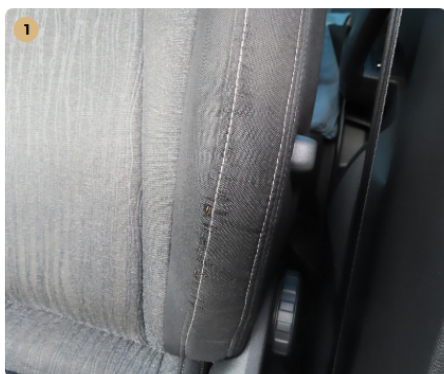
⚠ Jobb első ülés