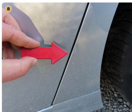
! bal hátsó sárvédő