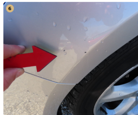
! bal első sárvédő