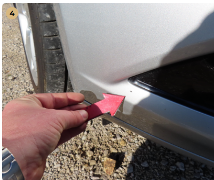
! első lökhárító