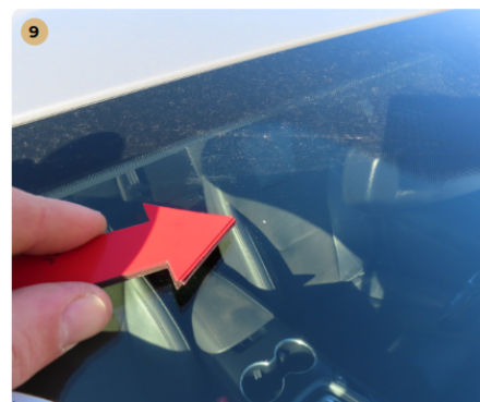
! első szélvédő