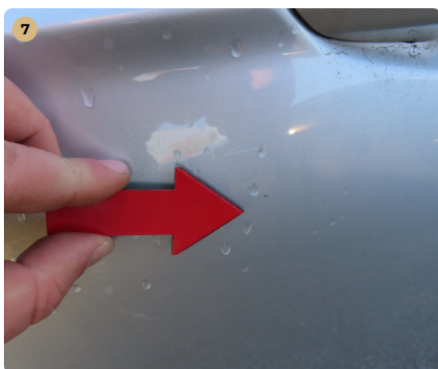
! bal első ajtó