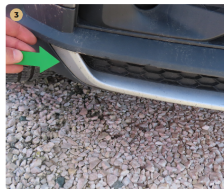
! első lökhárító horzsolt, kavicsos, fényérült