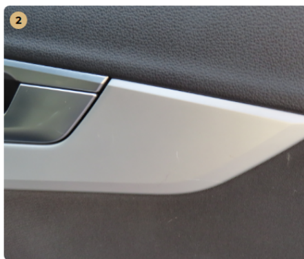
! bal első ajtókárpit díszléc karcosak