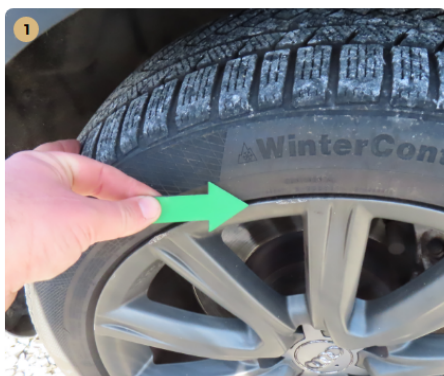
! bal első felni felni horzsoltak