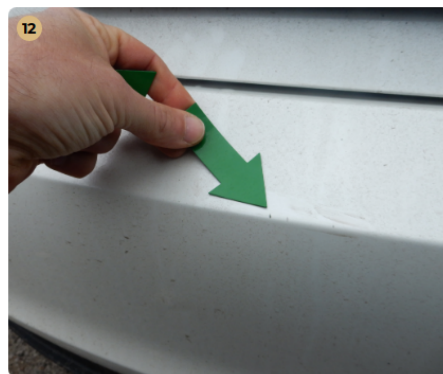
12 ! hátsó lökhárító Horzsolás