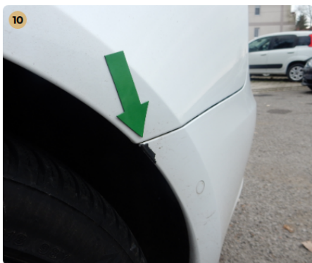
10 ! hátsó lökhárító Festék lepattogás