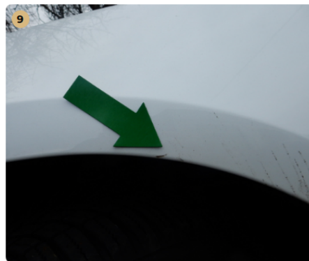
9 ! bal első sárvédő Kisebb húzásnyom