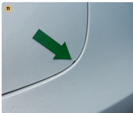
11 ! csomagtartótető Festék lepattogás