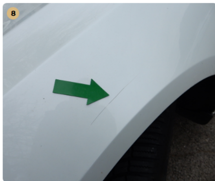
8 ! bal első sárvédő Karc