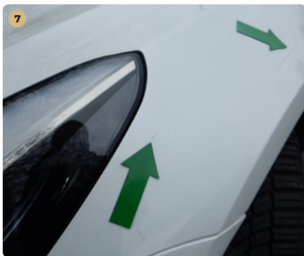
7 ! bal első sárvédő Karcolások