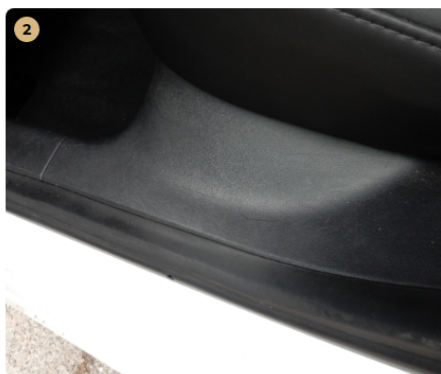
⚠ bal első üléskárpit