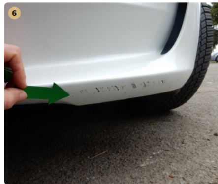
6 ! első lökhárító Horzsolás