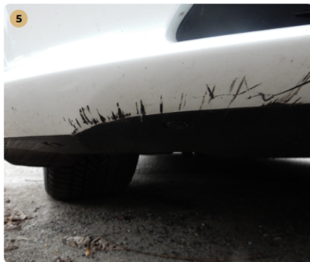
5 ! első lökhárító Horzsolás