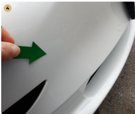
4 ! első lökhárító kavicsnyomok