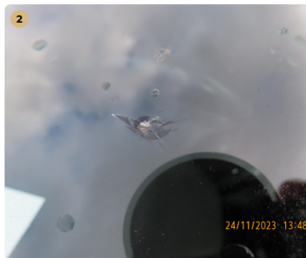
⚠ Első szélvédő Kavicsos repedt