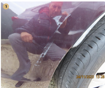
⚠ Hátsó lökhárító Karcos fénysérült