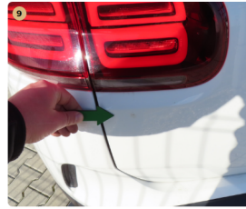
9 csomagtartótető fény sérülések