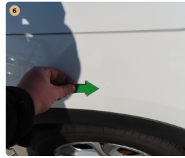
6 bal első sárvédő fény sérülés