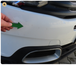
4 első lökhárító kavicsos