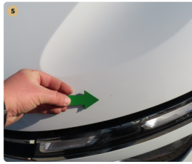
5 motorháztető apró kavics sérülések