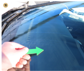
11 első szélvédő apró kavics sérülések