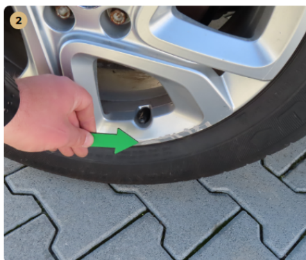
! jobb első felni horzsolt