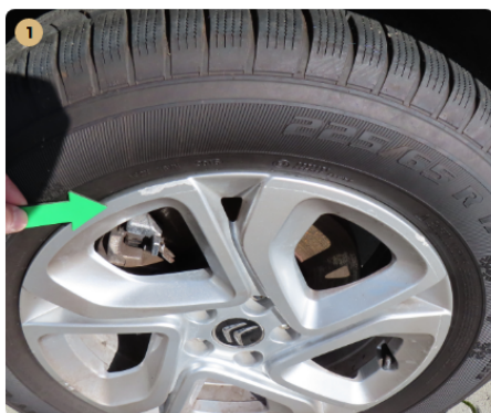
! bal első felni horzsolt