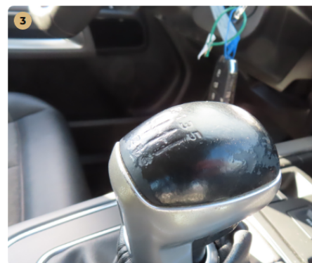
! műszerfal váltógomb kopott