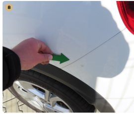
8 bal hátsó sárvédő fény sérülés