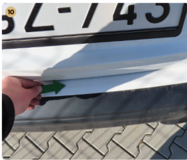
10 hátsó lökhárító enyhén karcos