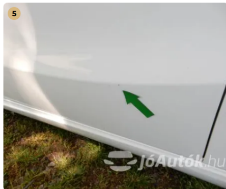
! Apró kavicsnyom a bal első ajtón