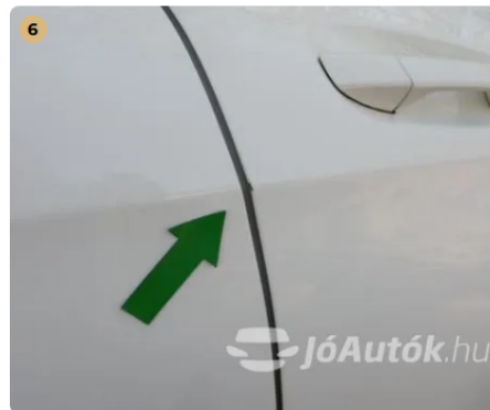
! Kisebb festék lepattogás a jobb első ajtó peremen