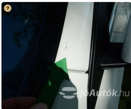
! Apró kavicsnyom az A oszlopon