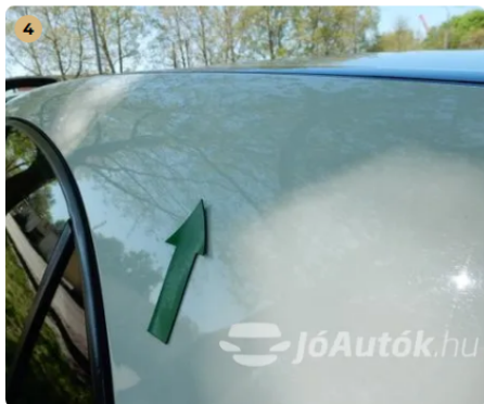
! Apró horpadás a C oszlopon