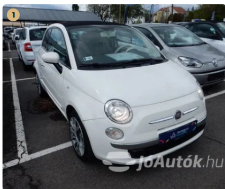
✓ Cabrio Cabrio