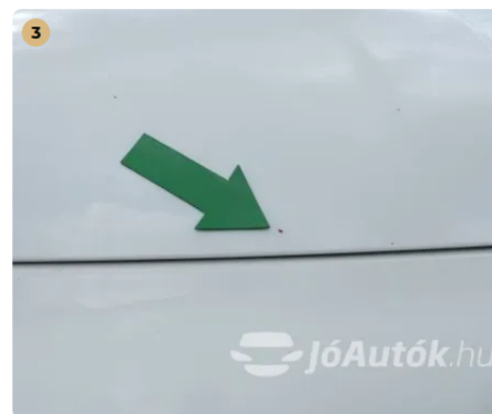
⚠ Kavicsnyom a motorháztetőn Kavicsnyom a motorháztetőn