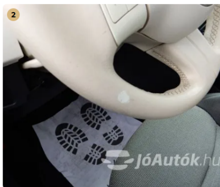
⚠ Folt a kormányon Folt a kormányon