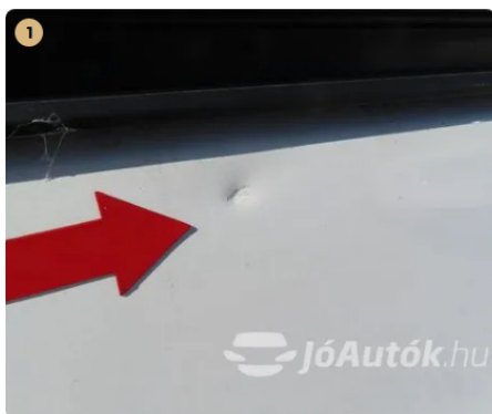
⚠ Jobb hátsó ajtón kicsi horpadás