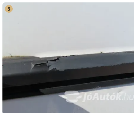
⚠ Festék lepattogzott a tolóajtó tartóján.