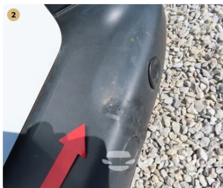
⚠ Hátsó lökhárítón kis nyomás.