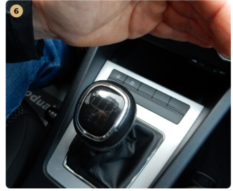
6 műszerfal Váltógomb kopott