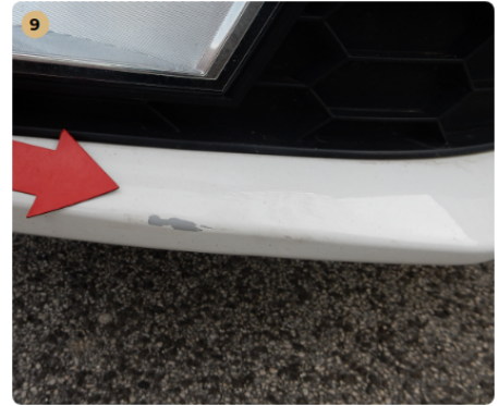
9 első lökhárító Kisebb sérülés