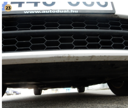
! első lökhárító