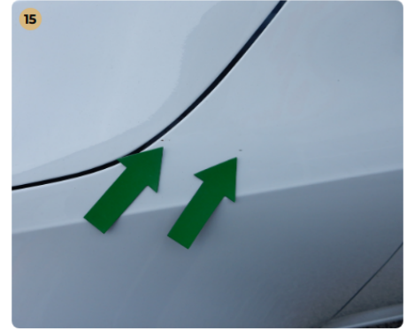
! bal első sárvédő