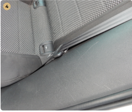
4 bal hátsó üléskárpit Karcok a burkolaton