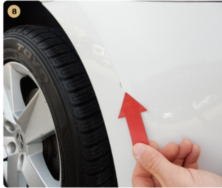
8 első lökhárító Horzsolás