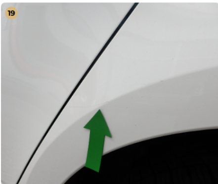
! bal hátsó sárvédő