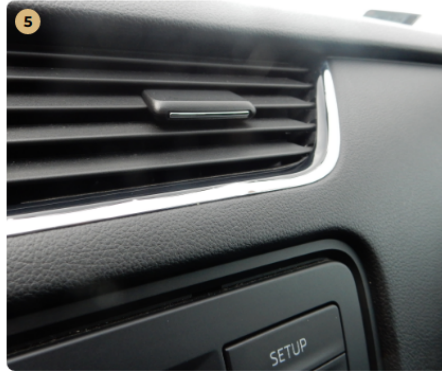
5 műszerfal Króm leválás