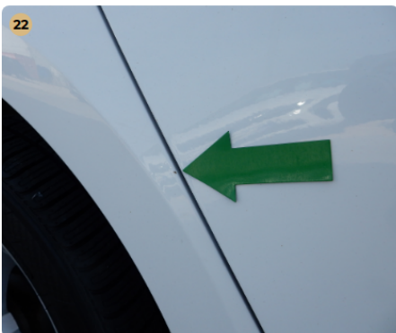
! jobb hátsó sárvédő