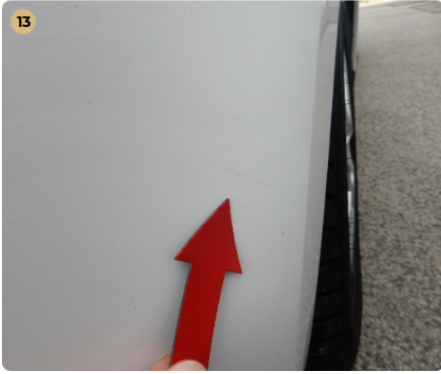
! bal első sárvédő