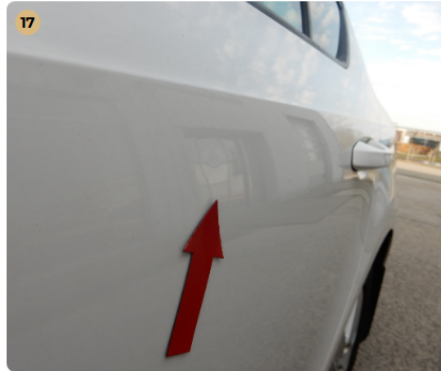
! bal hátsó ajtó