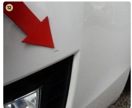
12 első lökhárító Kisebb horzsolás