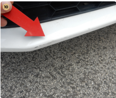
10 első lökhárító Kisebb sérülés