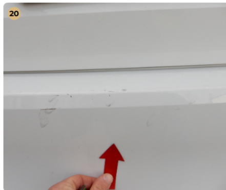
! hátsó lökhárító