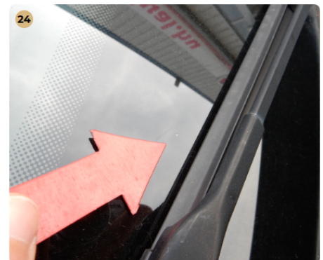
! első szélvédő