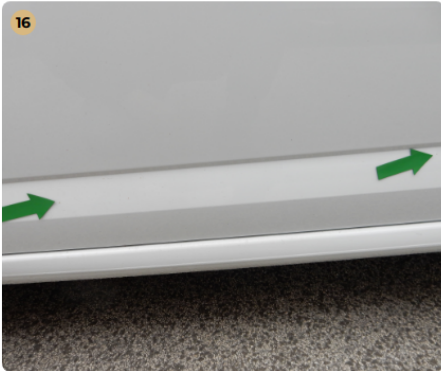
! bal első ajtó