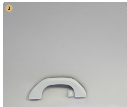
3 bal első üléskárpit