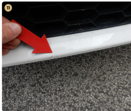
11 első lökhárító Több kisebb kavicsnyom