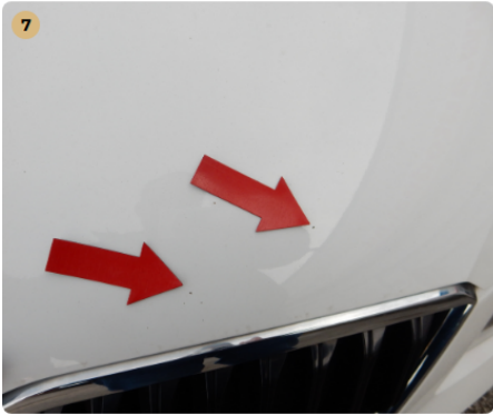
7 motorháztető Több apró kavicsnyom