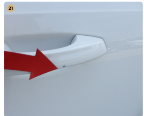
! jobb hátsó ajtó