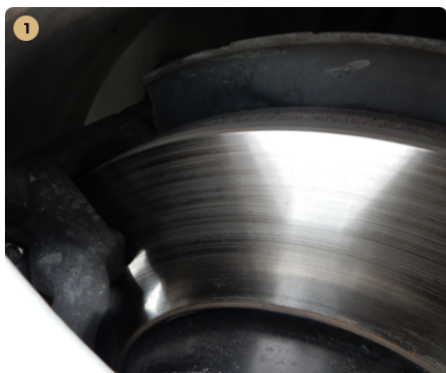
1 bal első féktárcsa