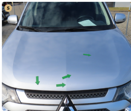
! motorháztető kavics sérülések