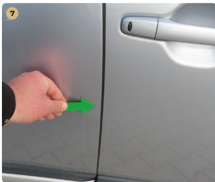
! jobb első ajtó fény sérülés