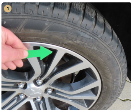
! bal első felni