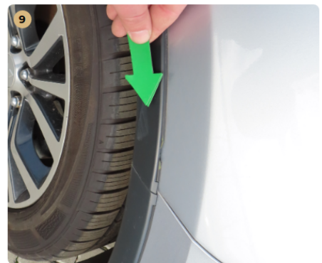
! jobb első sárvédő díszléc horzsolás