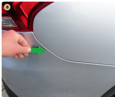
! jobb hátsó sárvédő horzsolás