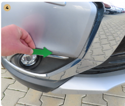
! első lökhárító kavics sérülések, horzsolás