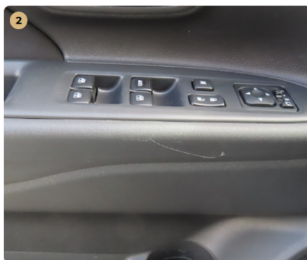
! bal első ajtókárpit