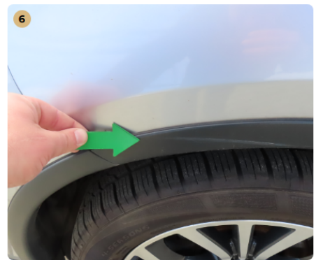
! bal első sárvédő díszléc horzsolás