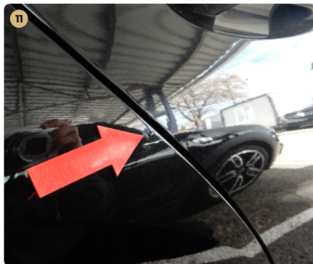
11 jobb hátsó ajtó Apró sérülés