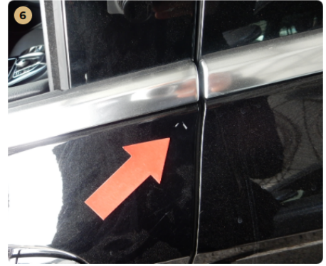
6 bal első ajtó Karcolás