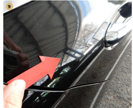
9 jobb hátsó ajtó Karcolás