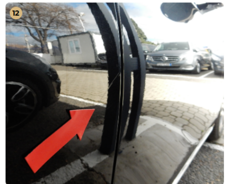
12 jobb hátsó ajtó Karcolás