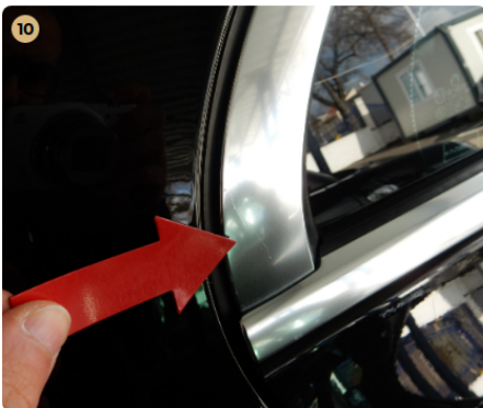
10 jobb hátsó ajtó Karcolás