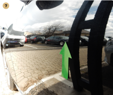
7 bal első ajtó Apró sérülés