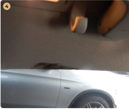
4 tetőkárpit Szennyeződés