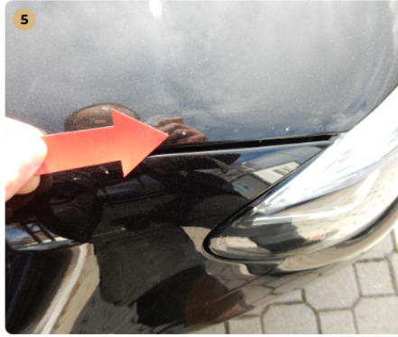
5 motorháztető Kavicsnyomok több helyen