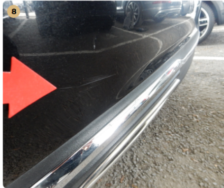
8 hátsó lökhárító Karcolás