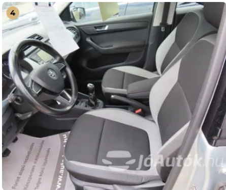
✓ megkímélt belső utastér