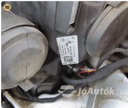
✓ gyári lámpák