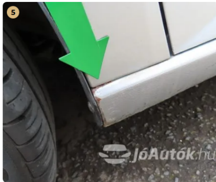
! bal első küszöb elején korrodáció