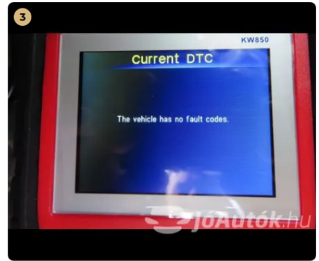
✓ nincs hibakód