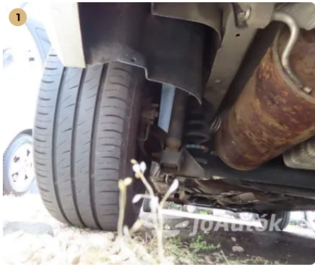
✓ száraz lengéscsillapítók