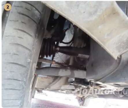
✓ porszáras féltengelyek