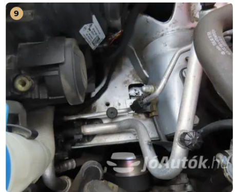
✓ gyári nyúlványok doblemezek