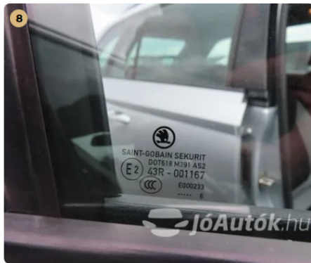
✓ gyári üvegek körbe