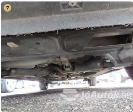
✓ nincs olajfolyás