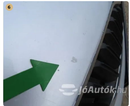
! motorház tetőn kavics leverődés