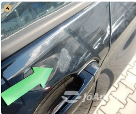
⚠ Bal első ajtón kisebb sérülés