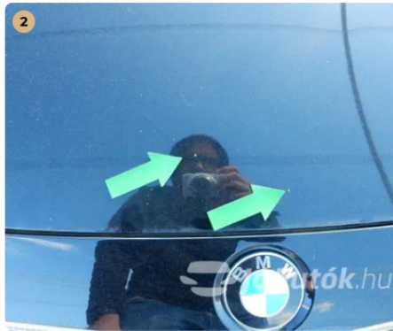
⚠ Kavicsnyomok a motorháztetőn