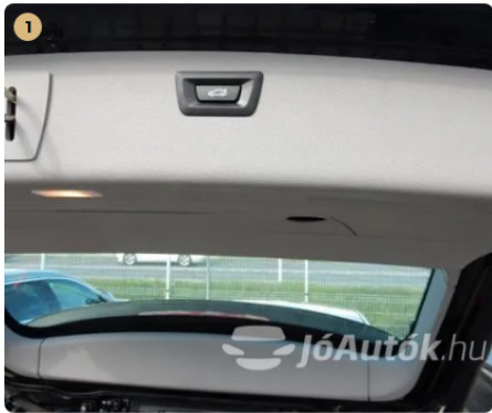
✔ Elektromos csomagterajtó