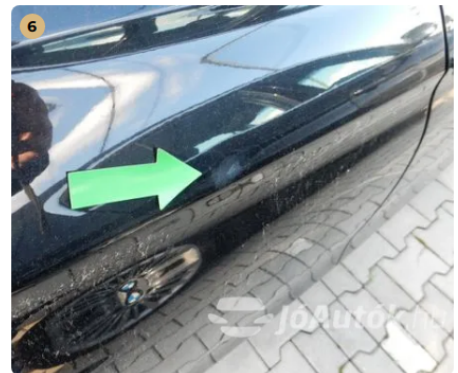
⚠ Jobb hátsó ajtón kisebb sérülés