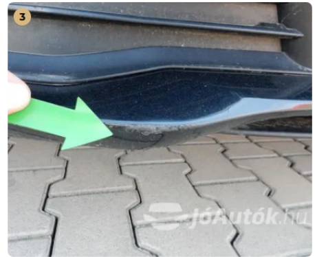
⚠ Horzsolás az első lökhárítón