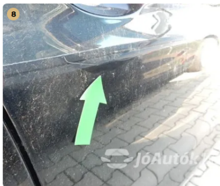
⚠ Karc a jobb első ajtón