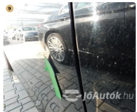
⚠ Kiseb horpadás a jobb hátsó ajtón