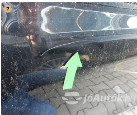
⚠ Karc a jobb hátsó ajtón