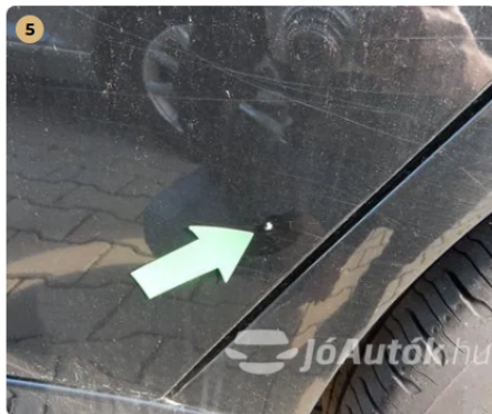
⚠ Bal hátsó ajtón apró sérülés