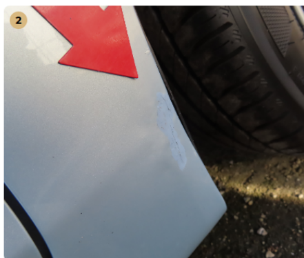
jobb első sárvédő