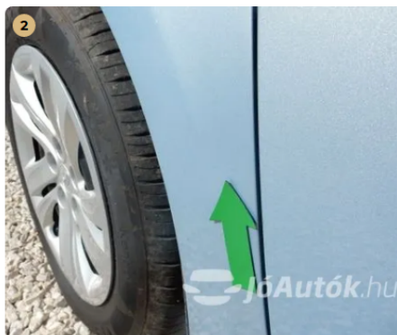
⚠ Apró horpadás a bal első sárvédőn