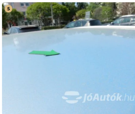
⚠ Apró horpadás a tetőn