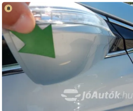
⚠ Horzsolás a jobb oldali tükrön