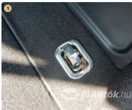
⚠ Korrózió a rakományrögzítőn