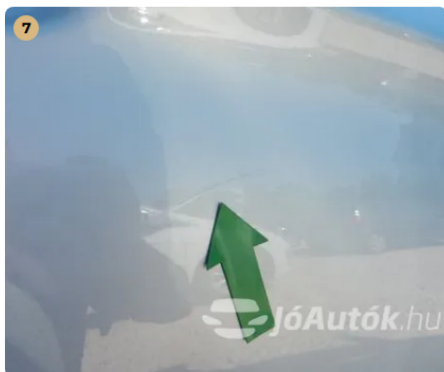
⚠ Karc a jobb hátsó ajtón