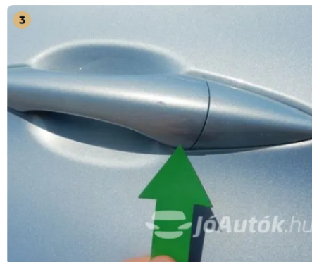
⚠ Horzsolás a bal első kilincsen