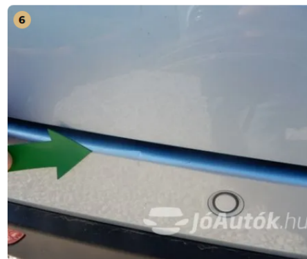
⚠ Apró hibák a fényezésen a hátsó lökhárítón