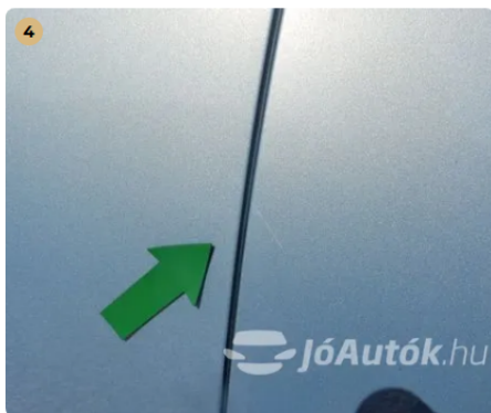
⚠ Karcolás a bal első-hátsó ajtón