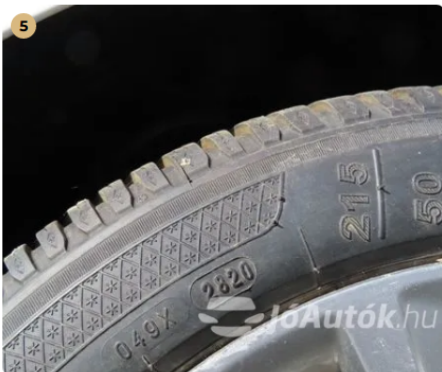
✓ Gumiabroncsok A gumiabroncsok odalfala nem repedett. -