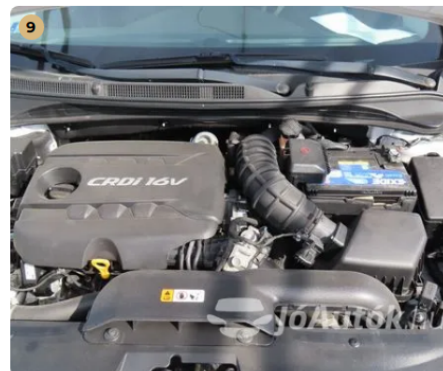
✓ Motor Motortérben olajfolyás nem látható. -