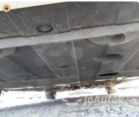
✓ Futómű A gumiharangokon szakadás, repedés nem látható. -