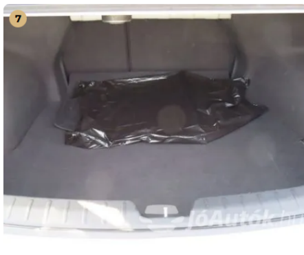
✓ Kárpitozás és belső burkolatok Csomagtartó kifogástalan állapotú. -