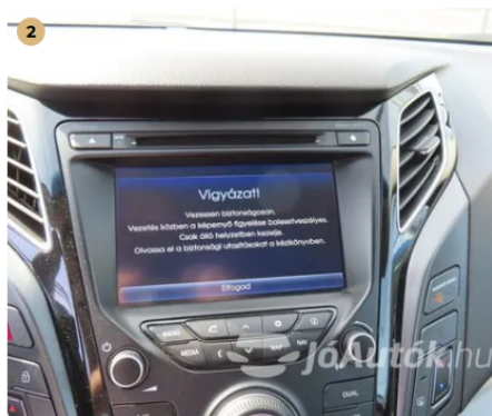
✓ Elektromos berendezések Műszerfénnyek megfelelően működnek. -