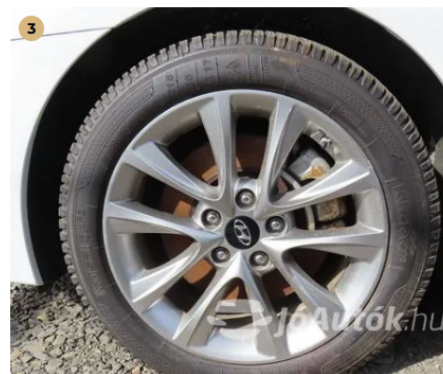
✓ Felnik Könnyűfém felni gyári. -