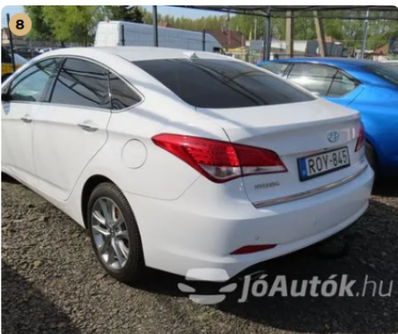
✓ Külső karosszéria elemek Műanyag lökhárítók szemrevételezés alapján javításra utaló nyom nem látható. -