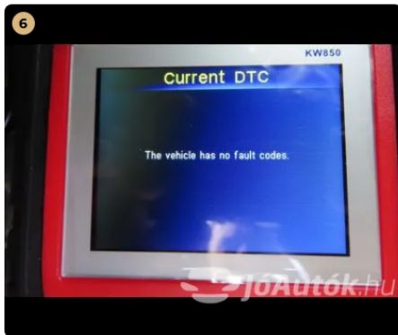
✓ Hibakód kiolvasása Számítógépes kiolvasás során nem találtam hibát. -