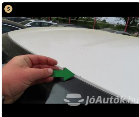
5 tető kavics sérülés, enyhén korrodált