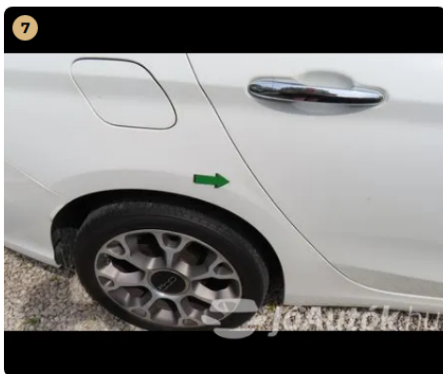
7 jobb hátsó sárvédő horpadás