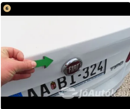
6 csomagter ajtó javítás nyomai láthatóak, fénysérülés, festég vastagság több elemen is a megengedettől magasabb