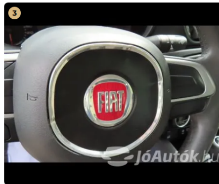
3 kormány közép be van horpadva