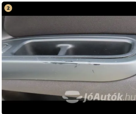
2 vezető oldali ajtó kárpit kopott