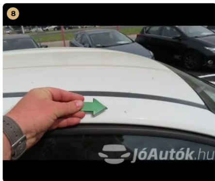
8 jobb oldali A oszlop fénysérülés