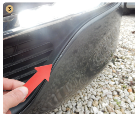
! első lökhárító