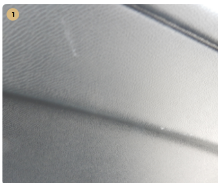
! bal első üléskárpit