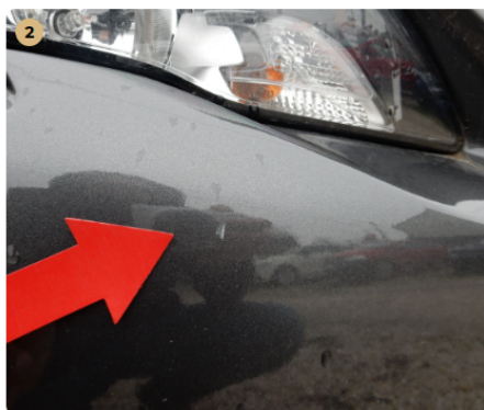
! első lökhárító