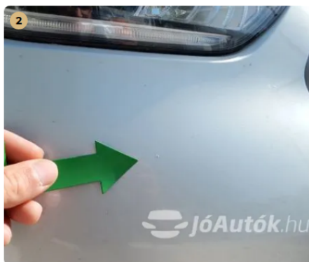
⚠ Kavicsnyomok a lökhárítón