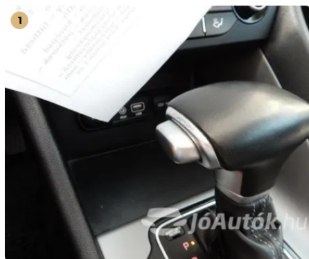
⚠ Kopás a váltógombon