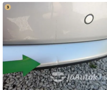
⚠ Kiseb sérülés a hátsó lökhárítón