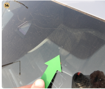
! első szélvédő