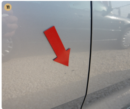
jobb hátsó ajtó