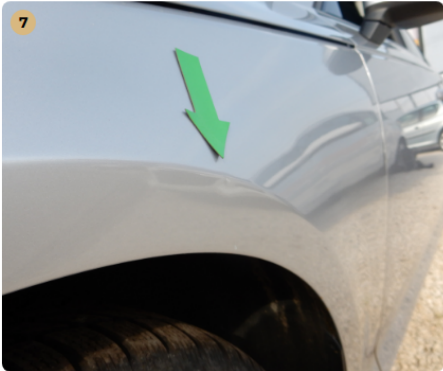
jobb első sárvédő