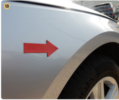
! jobb első sárvédő