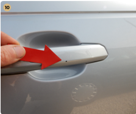
jobb hátsó ajtó