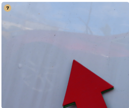
! bal hátsó sárvédő