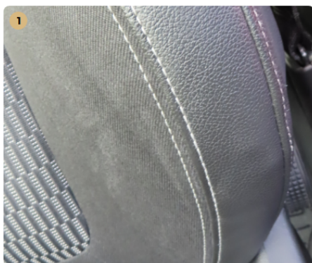
1 bal első üléskárpit