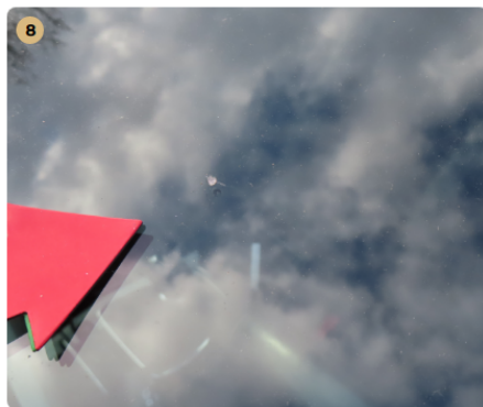
! első szélvédő