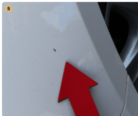
! bal első sárvédő