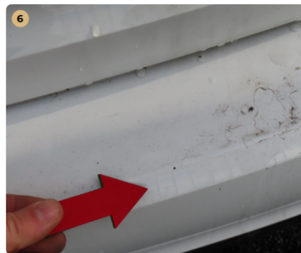
! hátsó lökhárító