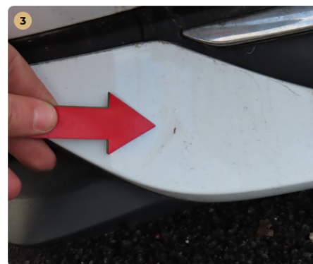
3 első lökhárító