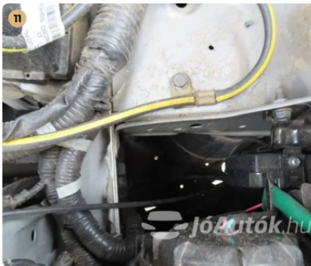
✓ Utascella és gyűrődő zónák A nyúlványokon külsérelmi nyomok nem találhatók. -