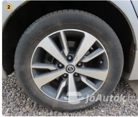
✓ Felnik Könnyűfém felni gyári. -