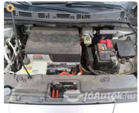
✓ Motor A motor poros, nem történt motortér mosás. -