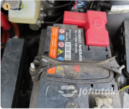
✓ Elektromos berendezések Akkumulátor gyári. -