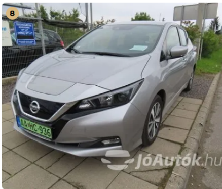
✓ Külső karosszéria elemek A karosszéria elemek közötti hézagok megfelelőek. -