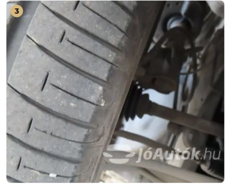
✓ Futómű A féltengelyen zsíros / olajos kicsapódás nem látható. -