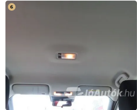
✓ Kárpitozás és belső burkolatok Tetőkárpit normál állapotú. -