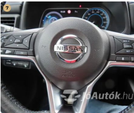
✓ Kárpitozás és belső burkolatok A kormánykerék gyári állapotú. -