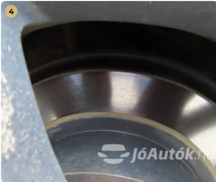
✓ Férendszer A féktárcsa megfelelő állapotban van. -