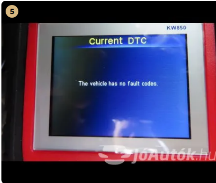
✓ Hibakód kiolvasása Számítógépes kiolvasás során nem találtam hibát. -