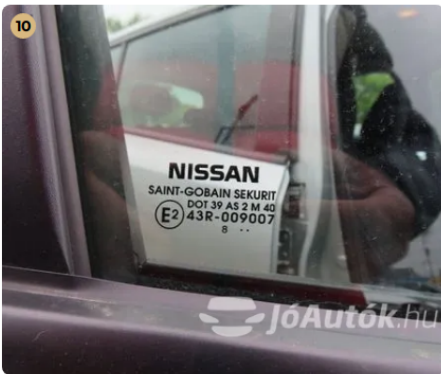
✓ Szélvédők, üvegek Oldalsó üvegen látható sérülés nincs. -