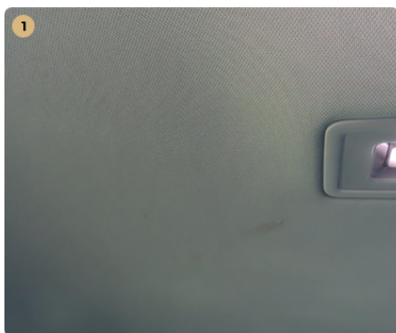
1 tetőkárpit szennyezett