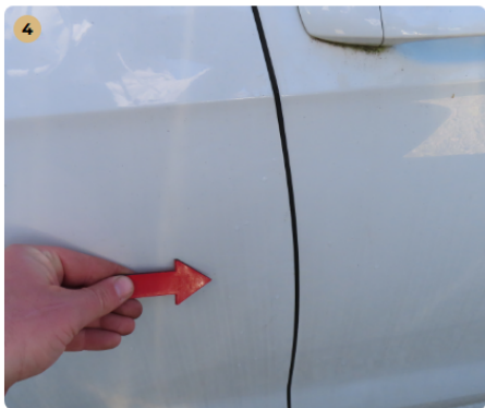
⚠ jobb hátsó ajtó fény sérülések