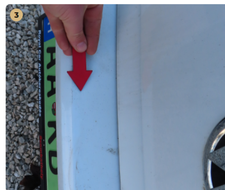
3 hátsó lökhárító karcos