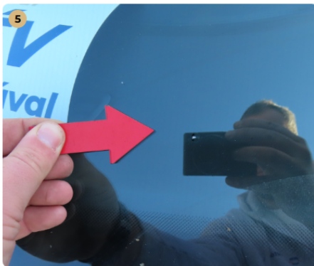
⚠ első szélvédő apró kőfelverődések