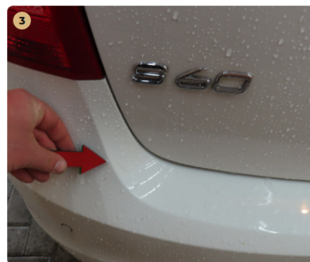
⚠ hátsó lökhárító apró fénysérülések