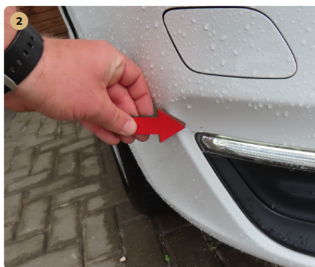
⚠ első lökhárító kavics sérülések, enyhe