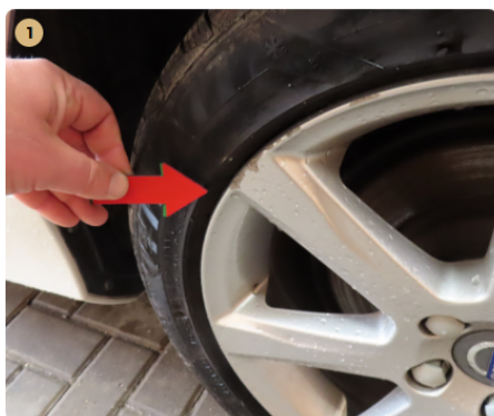
⚠ bal hátsó felni horzsolt