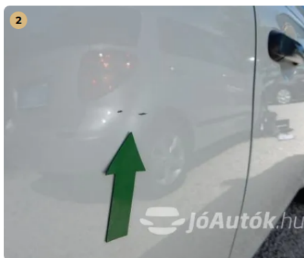
⚠ Karc a jobb hátsó ajtón