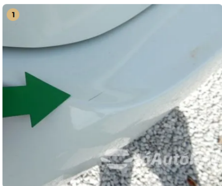
⚠ Karc a csomagtartón