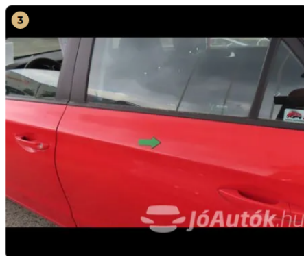
⚠ bal hátsó ajtó apró horpadás