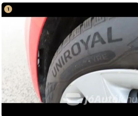
✓ gumiabroncsok újszerű állapotban