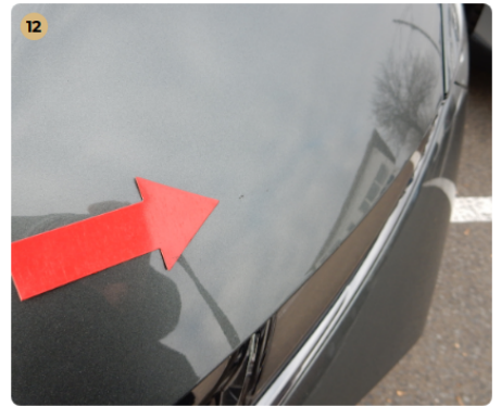
12 motorháztető Kavicsnyom