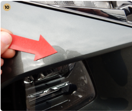
10 első lökhárító Kisebb sérülés