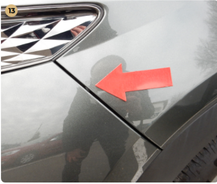
! bal első sárvédő Gyantafolt