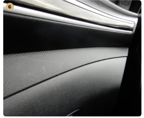
6 bal első ajtókárpit Karcolások