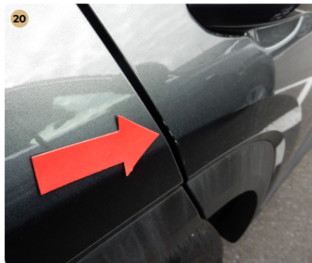
! jobb hátsó ajtó Kisebb festékhiba