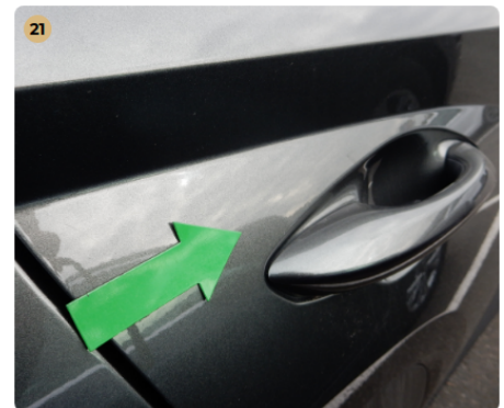
! jobb hátsó ajtó Kisebb festékhiba