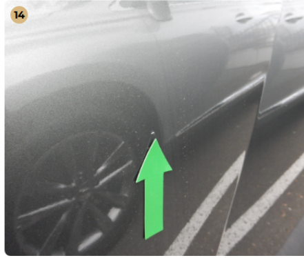
! bal első ajtó Apró fénysérülés