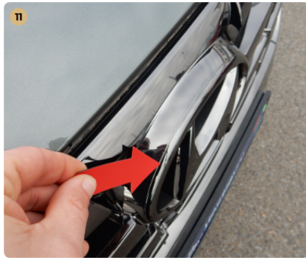
11 első lökhárító Kavicsnyomok