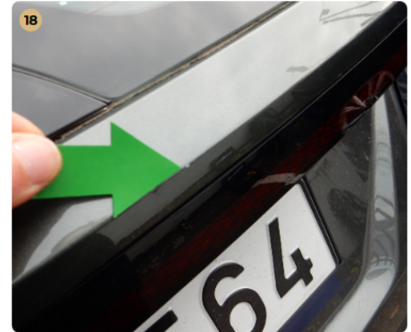
! csomagtartótető Apró festékhiba