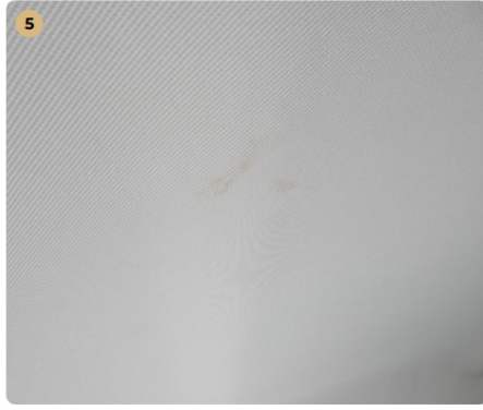
5 tetőkárpit Szennyezett