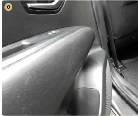
8 bal első ajtókárpit Karcolások