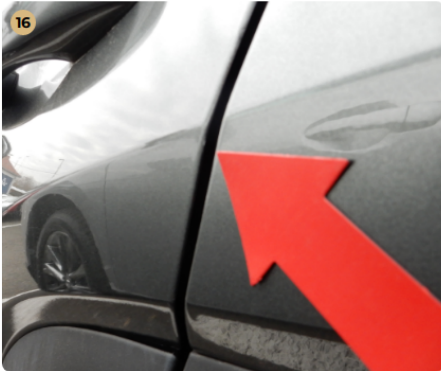
! bal első ajtó Apró festékhiba