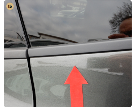
! bal hátsó ajtó Karcolás