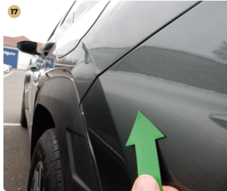
! hátsó lökhárító Karcolás