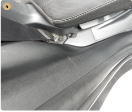
4 jobb hátsó ajtókárpit Karcolások