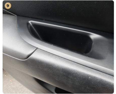
9 bal első ajtókárpit Karcolások