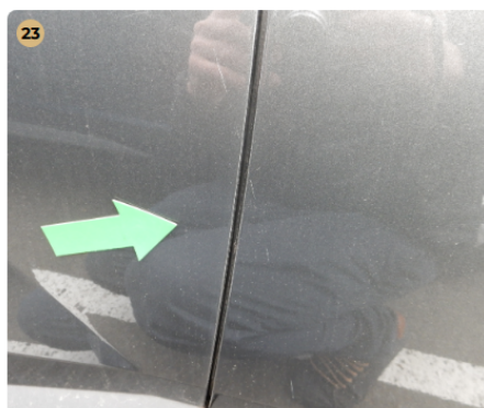
! jobb első ajtó Karc