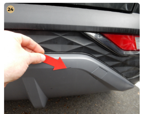
! hátsó lökhárító Kisebb festékhibák