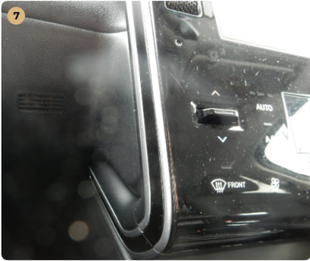
7 műszerfal Karcolások