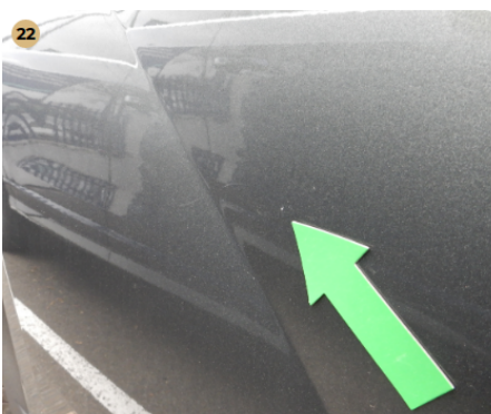
! jobb első ajtó Karcolás