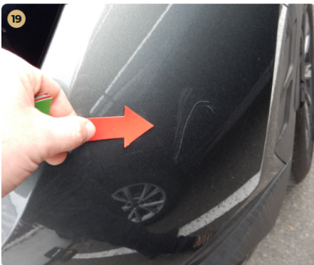
! hátsó lökhárító Karcolás