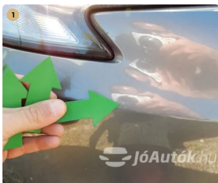
! Kavicsnyom az első lökhárítón