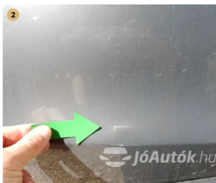
! Hátsó lökhárítón apró sérülés