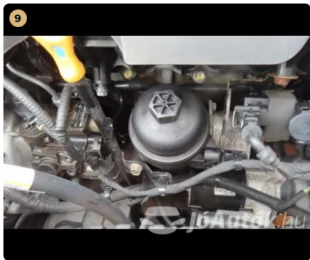
9 Utascella és gyűrődő zónák A nyúlványokon javításra utaló nyomok nem észlelhetőek. -