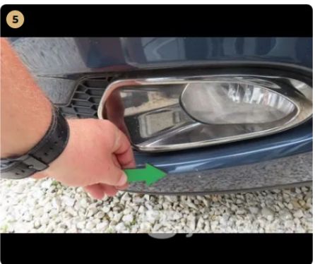
5 Külső karosszéria elemek Az autó használatából eredő apró kavicsfelverődések, hajszál karcok láthatóak. első vészháritón és motorháztetőn apró használatból eredő kavics sérülések találhatóak