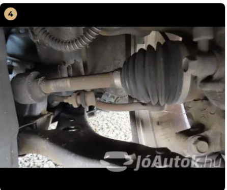
4 Futómű A féltengelyen zsíros / olajos kicsapódás nem látható. -