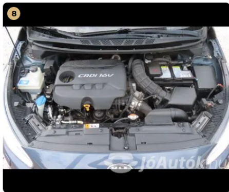
8 Motor Egyéb Kulturált, olajfolyás nem látható