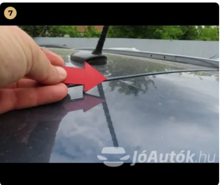
7 Külső karosszéria elemek Egyéb horzsolás, horpadás és fénysérülés található