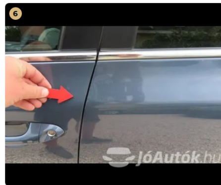
6 Külső karosszéria elemek Egyéb fénysérülések