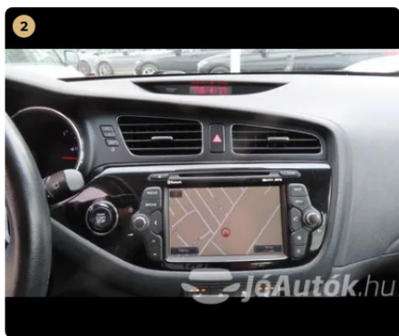
2 Extra tartozékok és felszereltségek Egyéb -