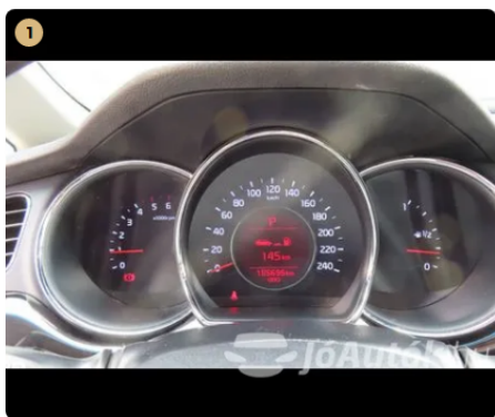
1 Elektromos berendezések Gombvilágítások megfelelően működnek. -