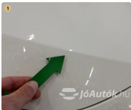
⚠ Kavicsnyomok a motorháztetőn