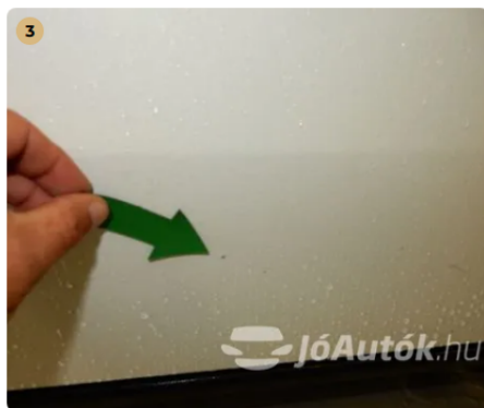
⚠ Apró kavicsnyom a jobb első ajtón