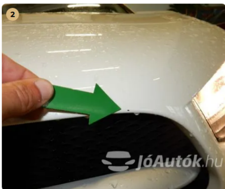
⚠ Kavicsnyomok az első lökhárítón