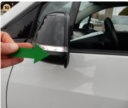
bal első ajtó Tükrore horzsolásnyom