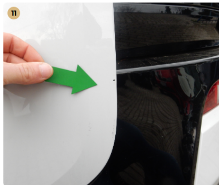
hátsó lökhárító Apró festékhiba