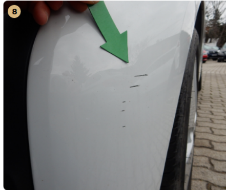
első lökhárító Kisebb húzásnyom