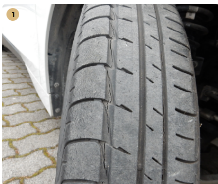
⚠️ jobb első gumi Gumi repedezett