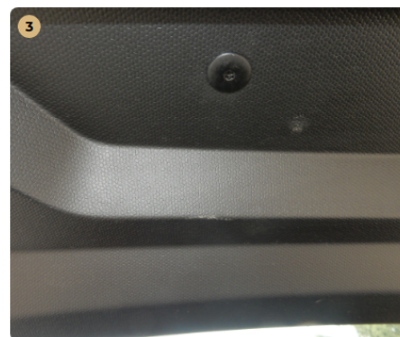
⚠️ Csomagtartó karcos burkolat