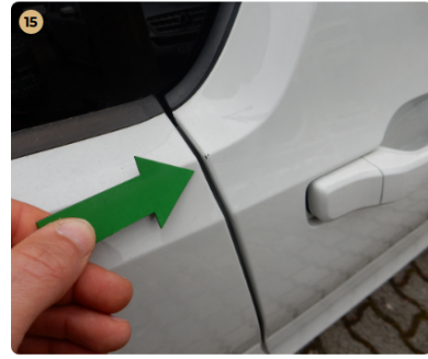
jobb első ajtó kisebb kavicsnyom