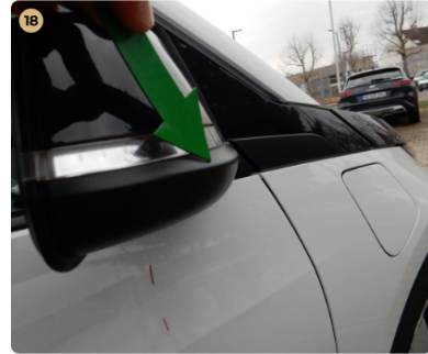
jobb első ajtó kisebb horzsolás a tükrön