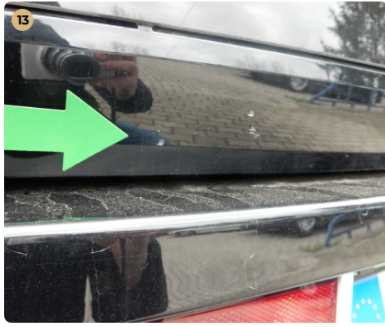
csomagtartótető Kisebb festékhibák