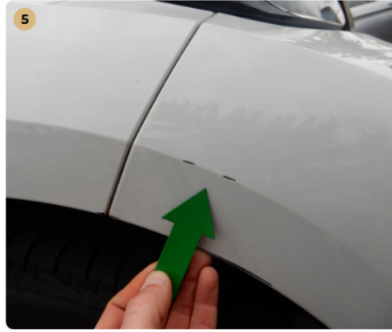
első lökhárító horzsolás