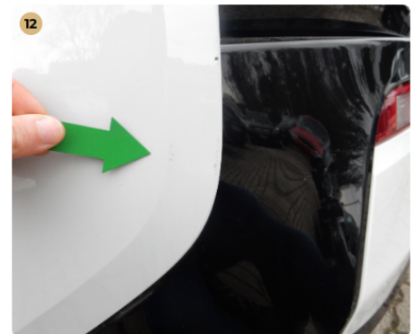
hátsó lökhárító Kisebb horzsolás