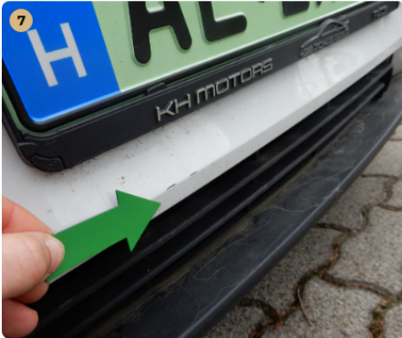
első lökhárító Kisebb horzsolás