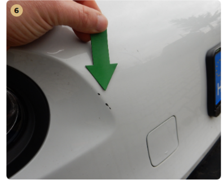
első lökhárító Kavicsfelverődések