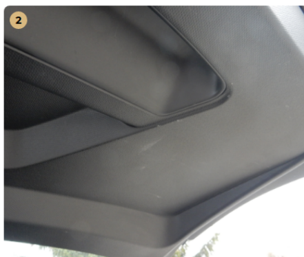
⚠️ Csomagtartó Karcos burkolat