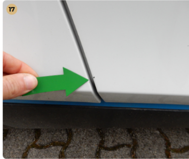
jobb első ajtó Kavicsnyomok több helyen