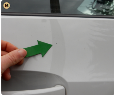
jobb első ajtó Apró festékhiba