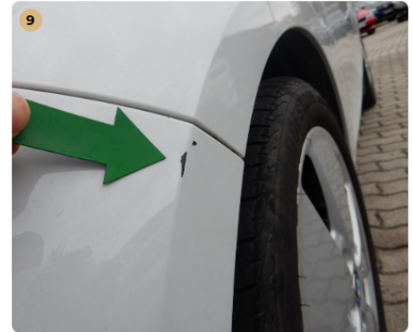
első lökhárító Kisebb festék lepattogás