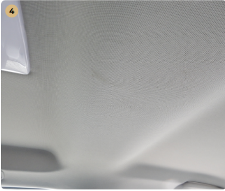
tetőkárpit Kisebb szennyeződés