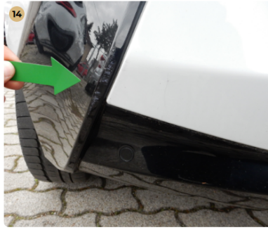
hátsó lökhárító Kisebb húzásnyom