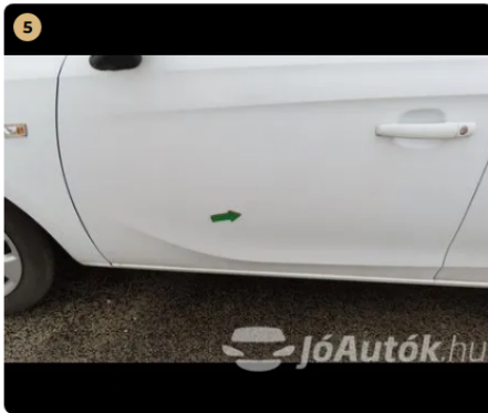
5 bal első ajtó horpadások, fénysérülések