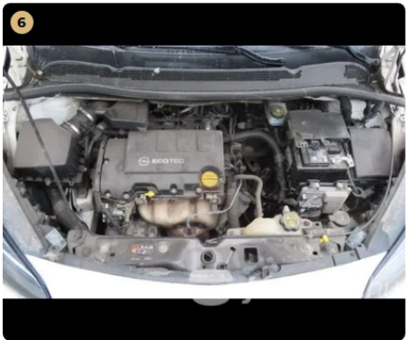
6 motor szépen, egyenletesen jár, folyadék szintek megfelelőek