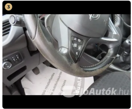
3 kormány kopott