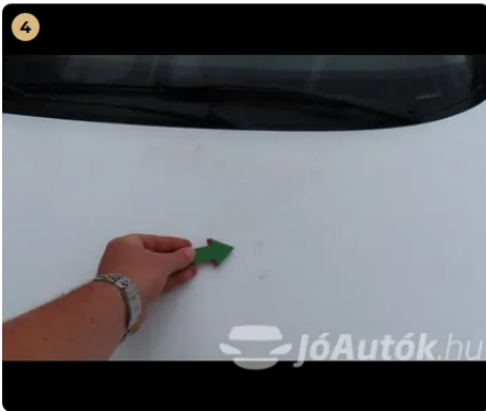
4 motorháztető kavics sérülések