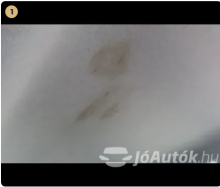
1 tetőkárpit szennyezett