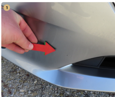
⚠️ első lökhárító apró fénysérülések