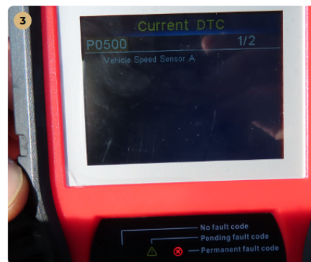
⚠️ motor szervíz esedékes