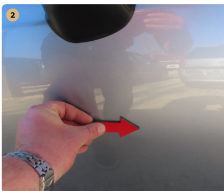
⚠️ jobb első ajtó apró horpadás