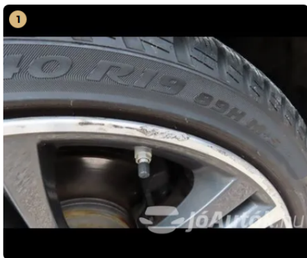
⚠ Bal első felni horzsolt