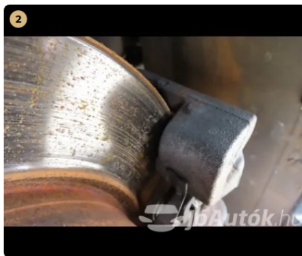
⚠ hátsó féktárcsák vállasak