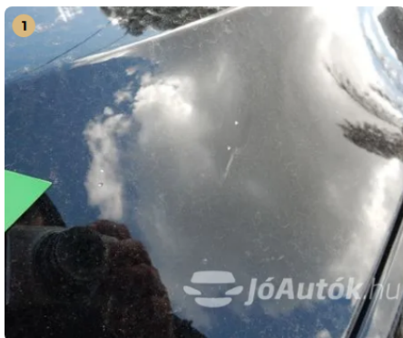
⚠ Apró kavicsnyomok a motorháztetőn Apró kavicsnyomok a motorháztetőn