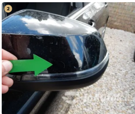
⚠ Karc a bal oldali tükrön Karc a bal oldali tükrön