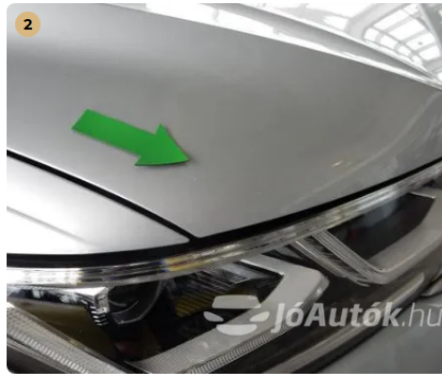
⚠ Kavicsnyomok a motorháztetőn