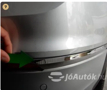
⚠ Hátsó lökhárítón kisebb horzsolás