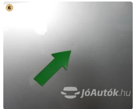
⚠ Bal első ajtón apró horpadás