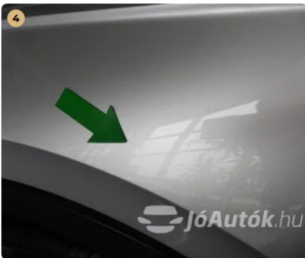
⚠ Bal első sárvédőn apró horpadás