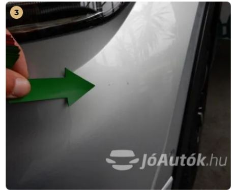
⚠ Kavicsnyomok az első lökhárítón