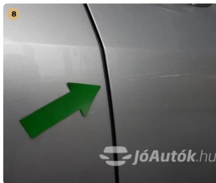
⚠ Jobb első ajtó peremen horzsolás