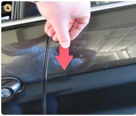
4 bal hátsó ajtó