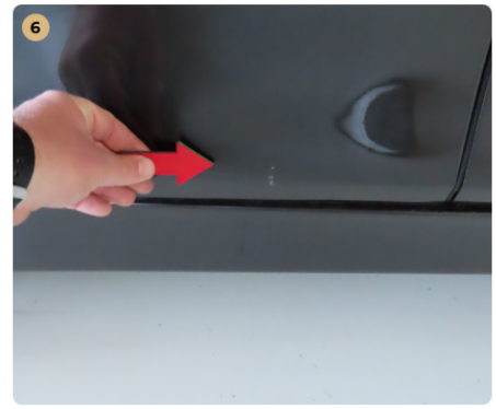
6 jobb első ajtó