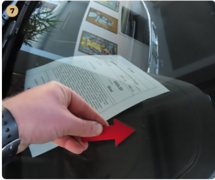
7 első szélvédő