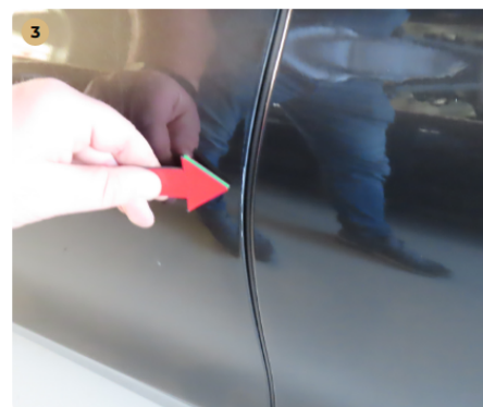
⚠ bal első ajtó