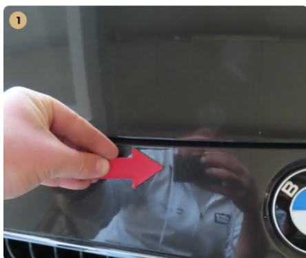
⚠ első lökhárító