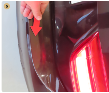
5 hátsó lökhárító