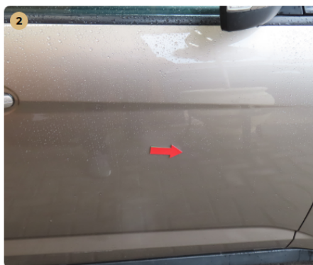
⚠ jobb első ajtó