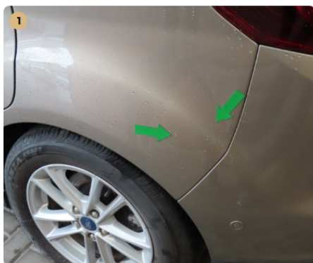
⚠ bal hátsó sárvédő