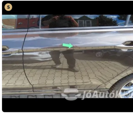
! bal hátsó ajtó pici horpadás