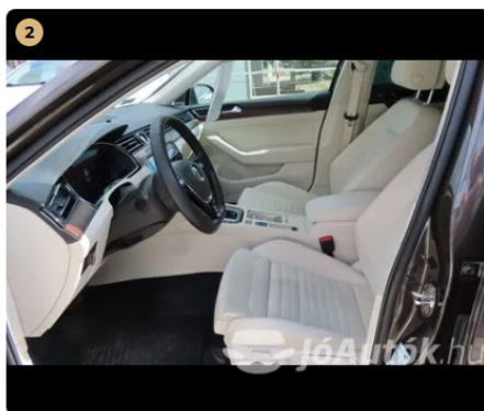
✓ belső kárpitozás kiváló állapotban