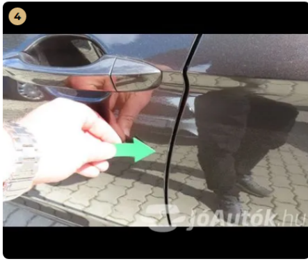
! bal első ajtó fénysérülés