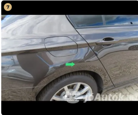
! jobb hátsó sárvédő horpadás