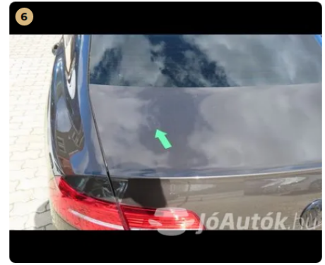
! csomagtér ajtó horpadás