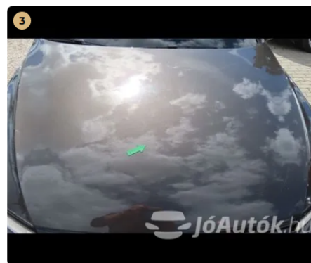
⚠ motorháztető kőfelverődés