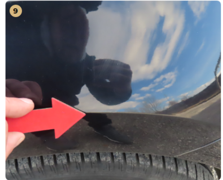
9 jobb első sárvédő