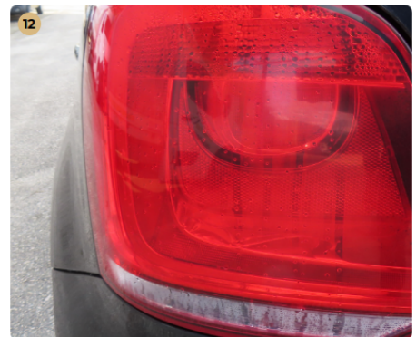
12 bal hátsó lámpa