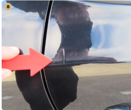
8 jobb hátsó ajtó