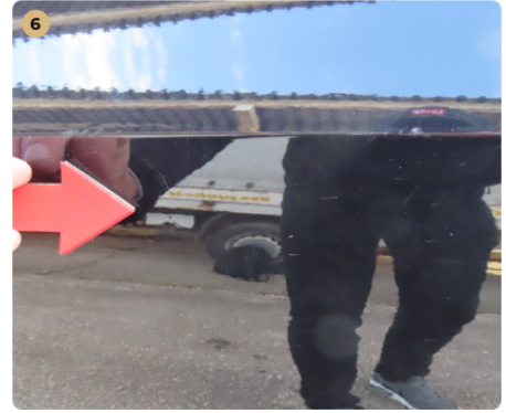
6 bal hátsó sárvédő