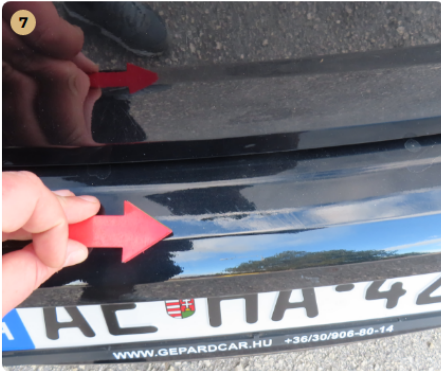
7 hátsó lökhárító