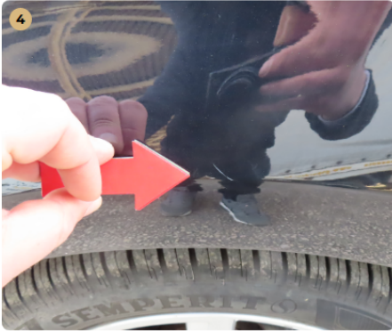
4 bal első sárvédő