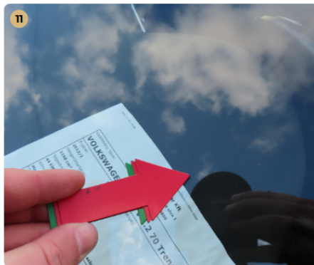
11 első szélvédő