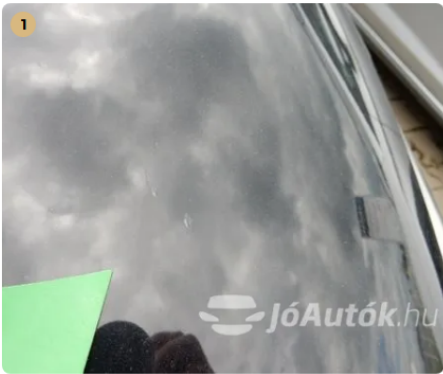
⚠ Kavicsnyomok a motorháztetőn