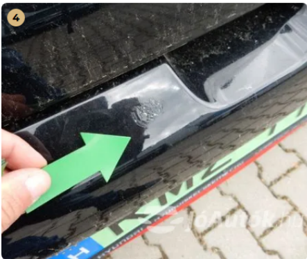
⚠ Apró sérülés a hátsó lökhárítón