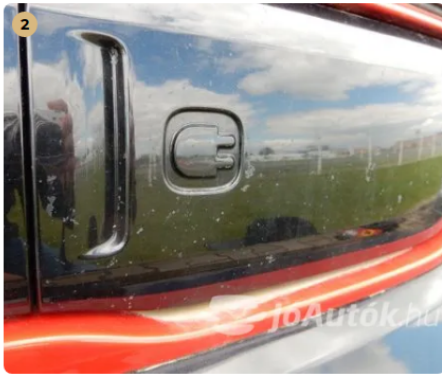
⚠ Sok apró kavicsnyom az első lökhárítón