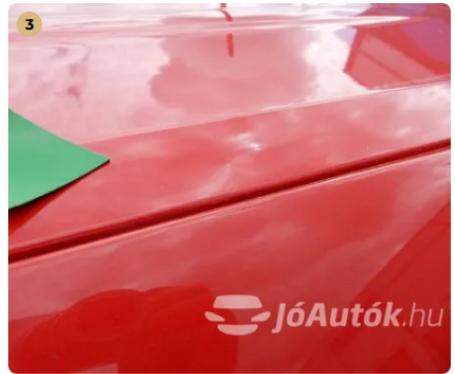
⚠ Apró "horpadás" a tetőn