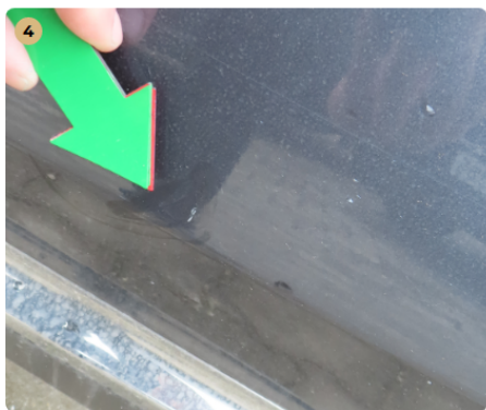
! bal hátsó ajtó karcos, fénysérült