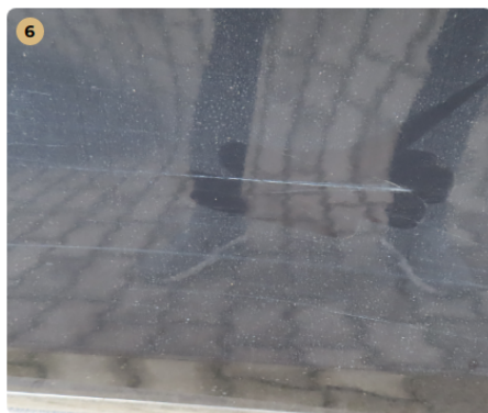
! jobb első ajtó karc