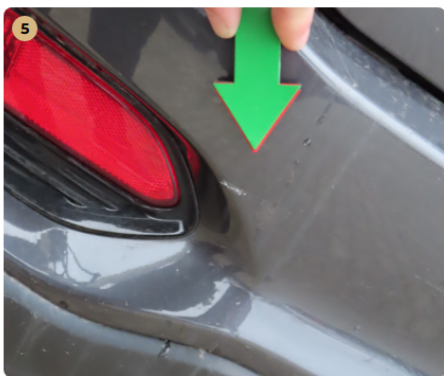
! hátsó lökhárító karcos, horzsolt