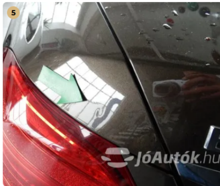
⚠ Apró horpadás a bal hátsó sárvédőn