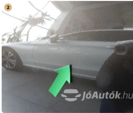
⚠ Apró karc a bal első ajtón