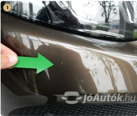
⚠ Első lökhárítón kavicsnyomok