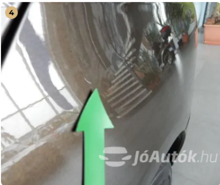
⚠ Karc a bal hátsó sárvédőn