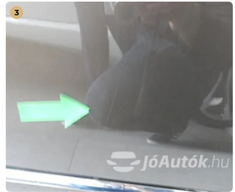
⚠ Karc a bal hátsó ajtón