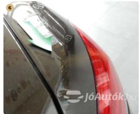
⚠ Apró horpadás a jobb hátsó sárvédőn