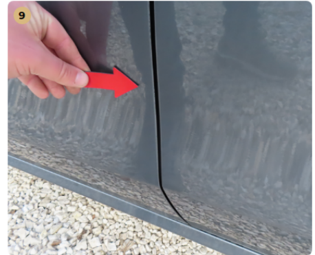
9 bal első ajtó fény sérült