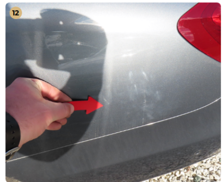
12 jobb hátsó sárvédő fény sérülés