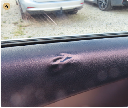
4 bal első ajtókárpít kopott