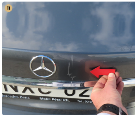
11 csomagtartótető karcos, fény sérült