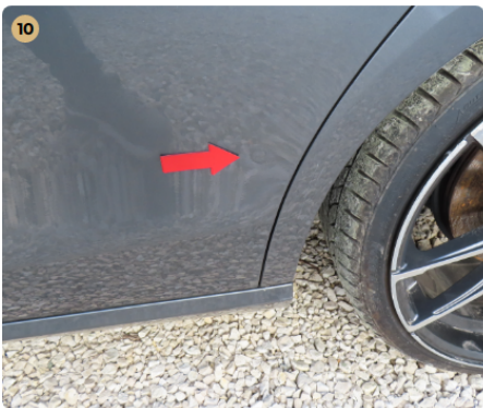
10 bal hátsó ajtó horpadás, fény sérülés