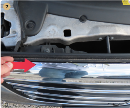
7 első lökhárító hűtőrács króm hibás