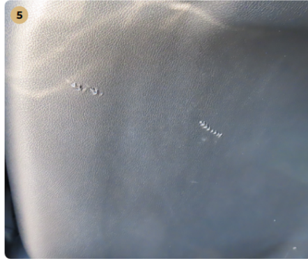
5 bal első üléskárpít háttámla karcos