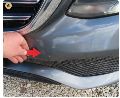
6 első lökhárító karcos, kavics sérült