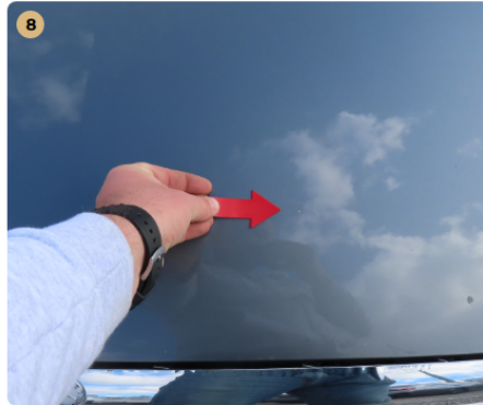
8 motorháztető kavics sérült