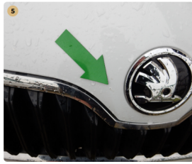
5 motorháztető Kavicsnyomok