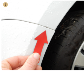
7 bal első sárvédő Festék lepattogás