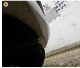
9 első lökhárító Koptató kopott