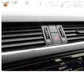
4 műszerfal Csúszka hiányzik