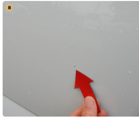
8 bal első ajtó Kavicsnyom