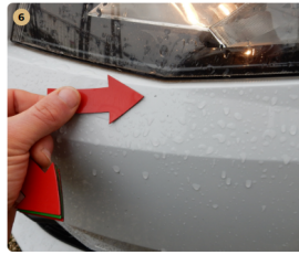
6 első lökhárító Kavicsnyomok