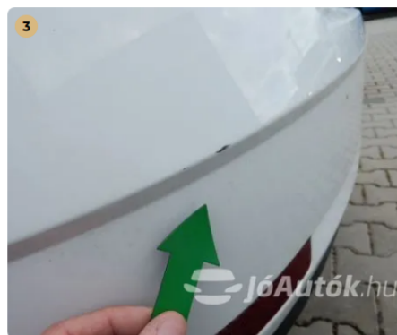
⚠ Horzsolás a hátsó lökhárítón