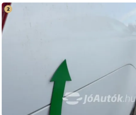
⚠ Jobb hátsó sárvédőn apró horpadás