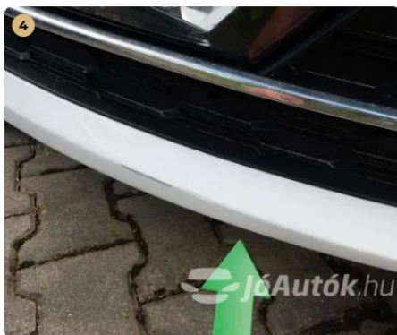
⚠ Horzsolás az első lökhárítón