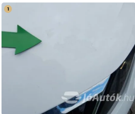
⚠ Motorháztetőn lakkhiba