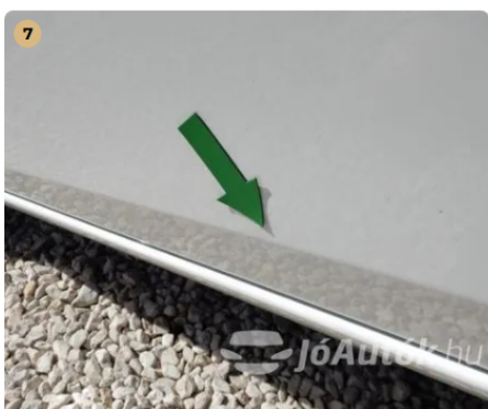
! Apró horpadás a bal első ajtón