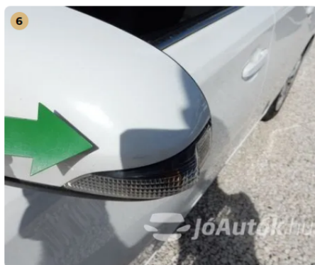
! Karc a bal oldali tükrön