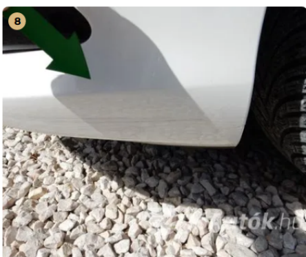
! Horzsolás az első lökhárítón