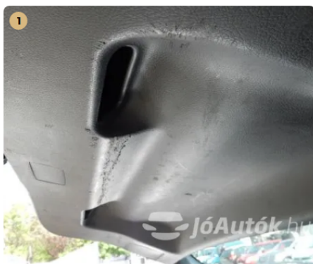
⚠ Karcos csomagtérburkolat