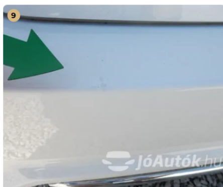
! Apró sérülés a hátsó lökhárítón