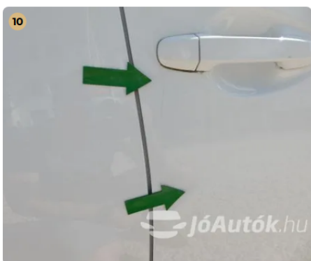
! Karcolás a jobb első ajtón