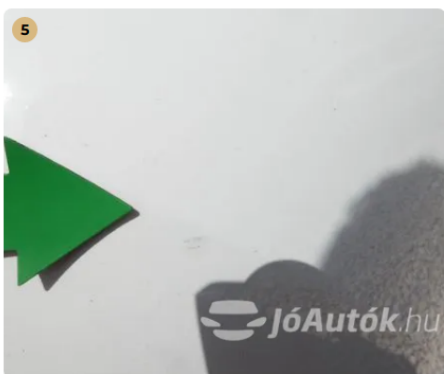
! Karc az első lökhárítón