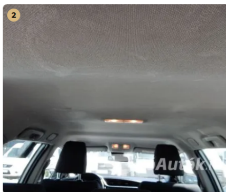
⚠ Karcos tetőkárpit