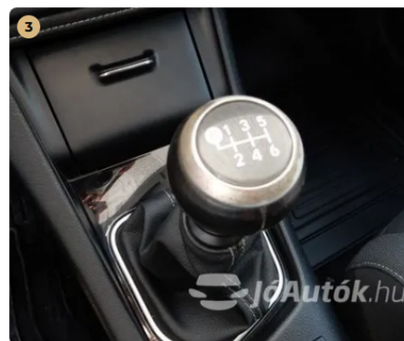
⚠ Kopott váltógom