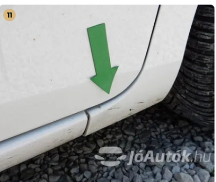
! Kisebb horpadás a jobb első sárvédő alján