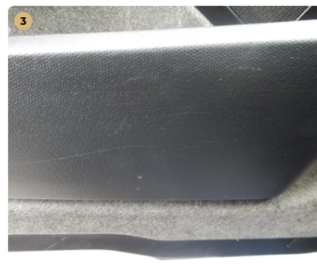
3 bal első ajtókárpit