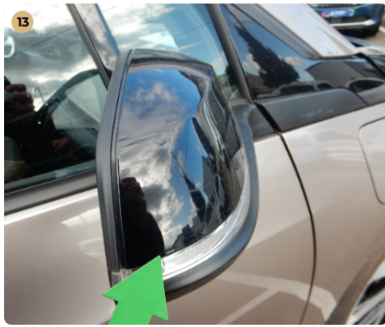
13 ! jobb első ajtó