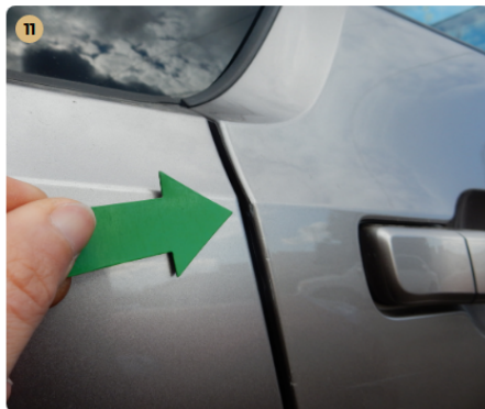
! jobb első ajtó Kisebb sérülés