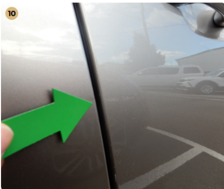
! jobb első ajtó Kisebb sérülés