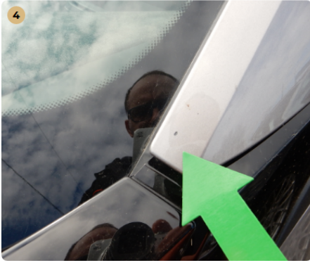
! tető A oszlop kavicsnyom