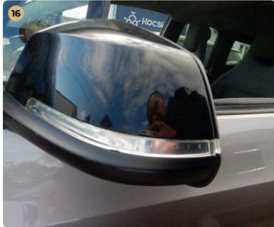
16 ! bal első ajtó