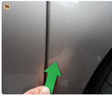
14 ! jobb első sárvédő