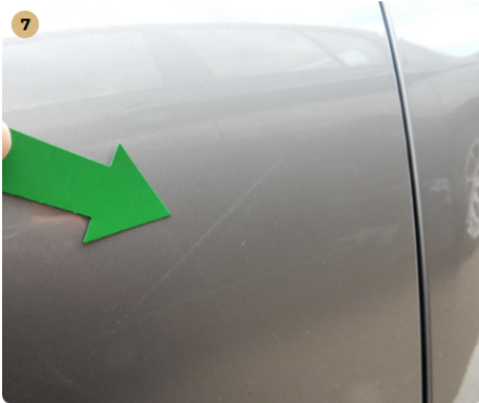
! bal első ajtó Karcolások