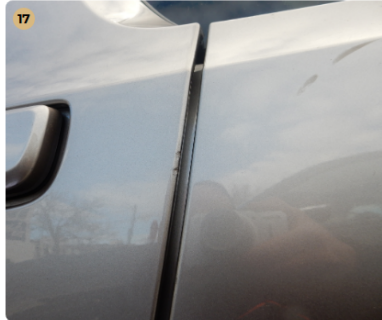
17 ! bal első ajtó