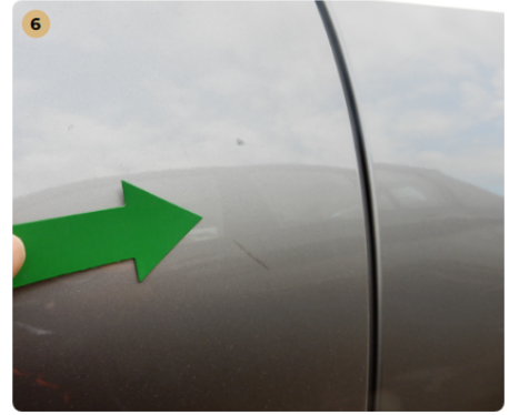
! bal első ajtó Karcolások