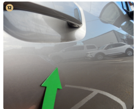
! jobb első ajtó Karcolás