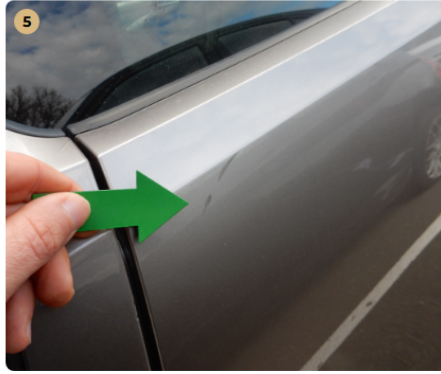
! bal első ajtó Apró horzsolás