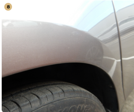
! jobb hátsó sárvédő Karcos az egész sárvédőív