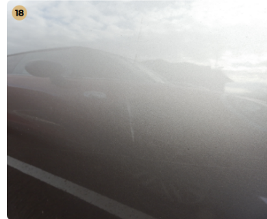
18 ! bal első ajtó