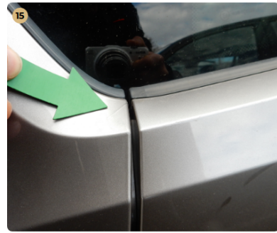
15 ! jobb hátsó sárvédő